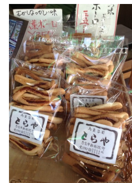
松葉ポーロ 350 円

ならまち界隈で毎年 6 月に開催される にやらまちねこ祭り そのお祭に合わせて作られた ねこのお菓子です。