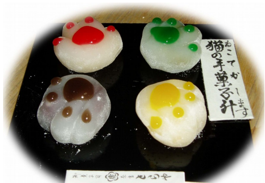
猫の手菓子升 各 240 円