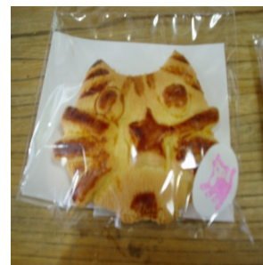
にゃんこポーロ 親猫 600 円 (写真: 上) 招き猫 800 円 (写真: 左上) 小 150 円 (写真: 右上)

食べるのがもったいない! しばらく飾っていたくなるポーロです。 2ヶ月程度は保存が出来ます!