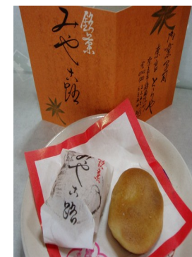
みやこ路 100 円