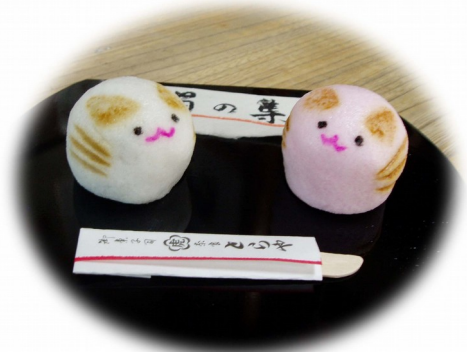
猫の集会 各 240 円

ならまち界隈で毎年 6 月に開催される にやらまちねこ祭り そのお祭に合わせて作られた ねこのお菓子です。