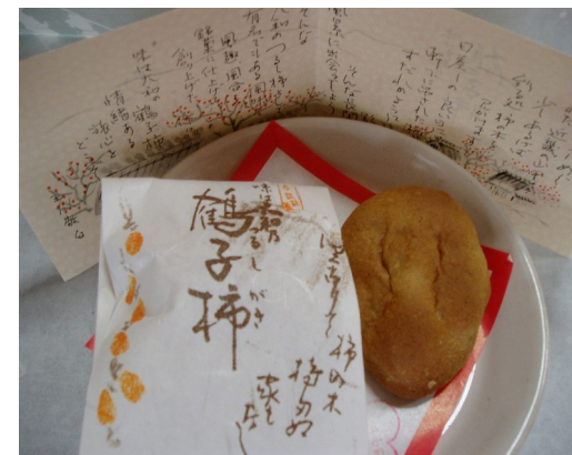
鶴子柿 220 円